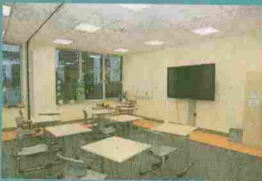
Die Klassenräume erhielten eine moderne Ausstattung inklusive sogenannter „Activeboards“

„der schließt dann an den Parkplatz an, wird mehr Platz bieten und den aktuellen Brandschutzanforderungen entsprechen.“