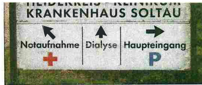
Das Heidekreis-Klinikums in Soltau lädt zu „Stunden der offenen Tür“ in der Notaufnahme ein.

Nahbereichsfahndung noch auf der Anfahrt eine Tatverdächtige fest. Dazu ein Sprecher der Polizei: „Eine Antwort auf die Frage, ob die Festgenommene auch für die seit November 2019 andauernde Brandserie in und um Bispingen verantwortlich ist, werden die Ermittlungen in den nächsten Tagen und Wochen ergeben.“