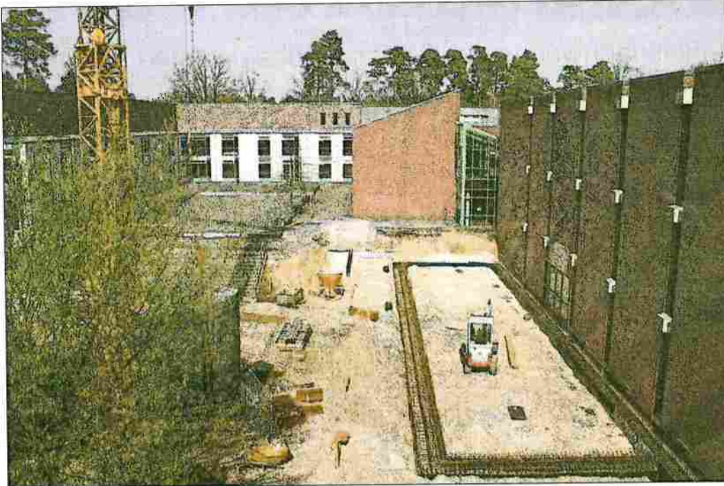
Schulhof als Baustelle: Dort entstand der Anbau an den C-Trakt.

Und wer daran interessiert ist, wie das Ergebnis aussieht, kann am morgigen Donnerstag zu einem Rundgang durch die fertigen Räume starten. Nach der offiziellen Eröffnungszeremonie mit geladenen Gästen, steht die Schule am 16. Januar ab 17 Uhr für Besucher offen: „Interessierte