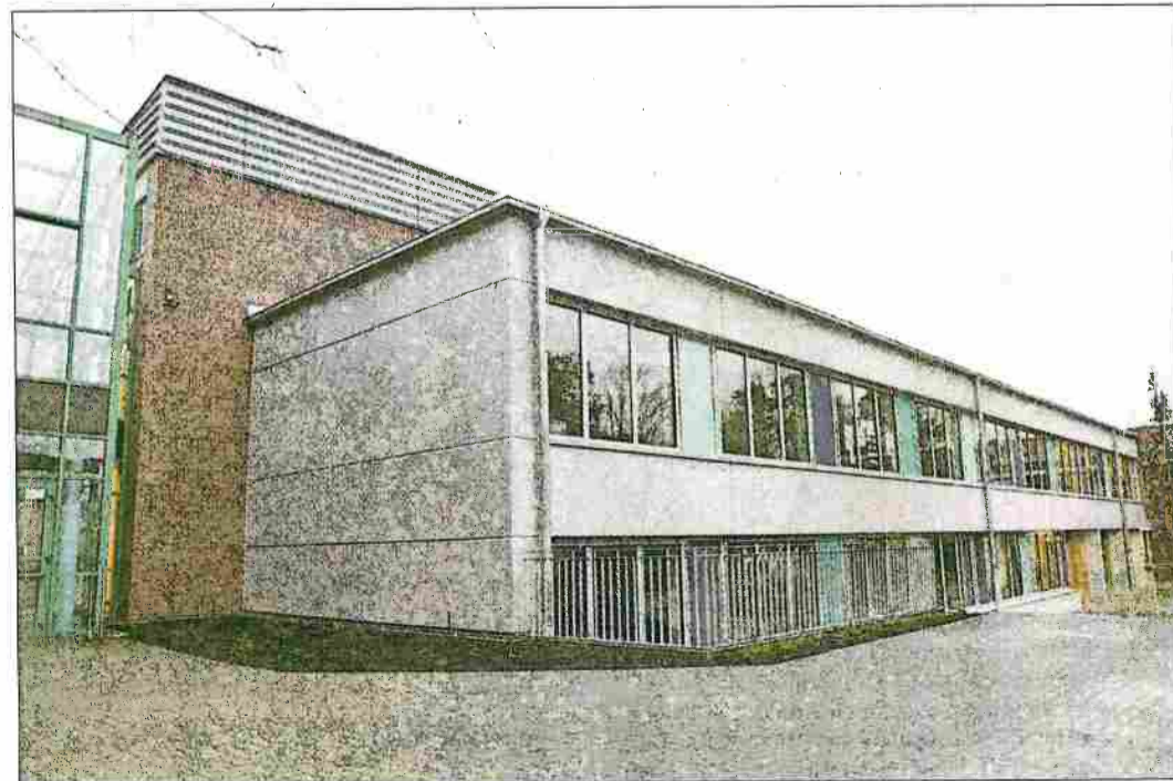
An den alten C-Trakt (Backstein) wurde ein Anbau angesetzt. Der neue Gebäudeteil (grau) brachte acht zusätzliche Unterrichtsräume.