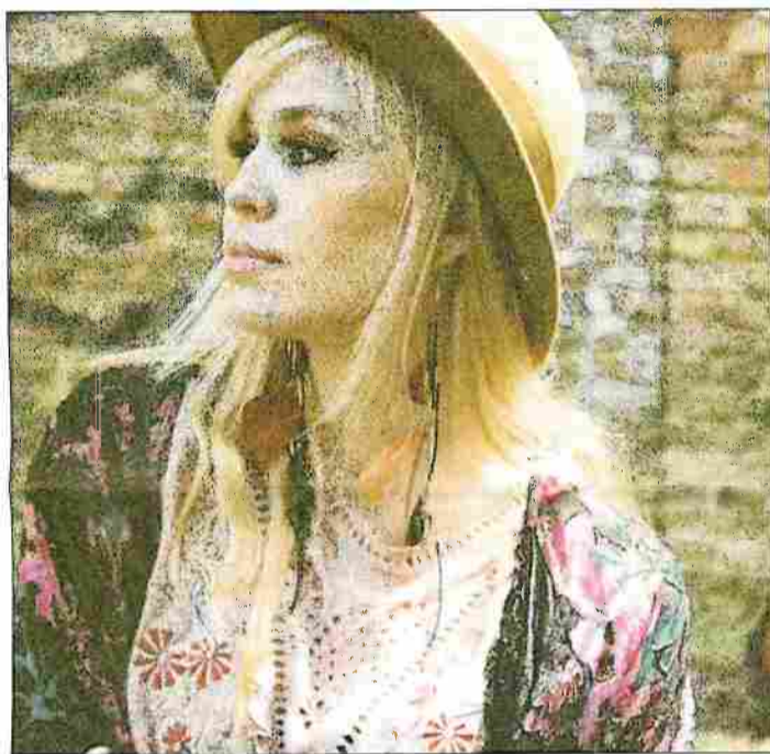
Am 17. Januar in Soltau: Sofia Talvik.