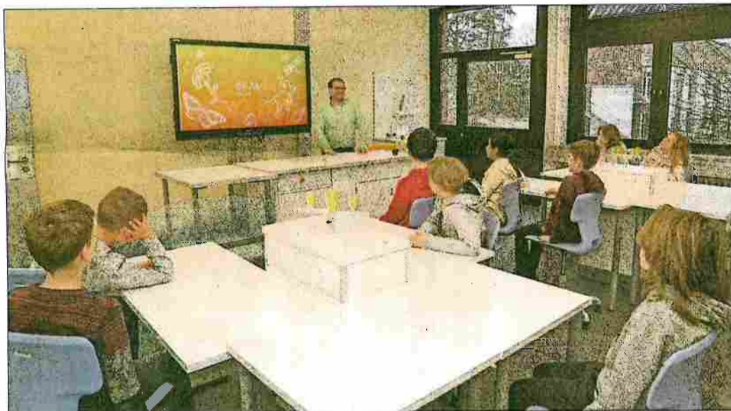
Neue Ausstattung in den naturwissenschaftlichen Fachunterrichtsräumen.