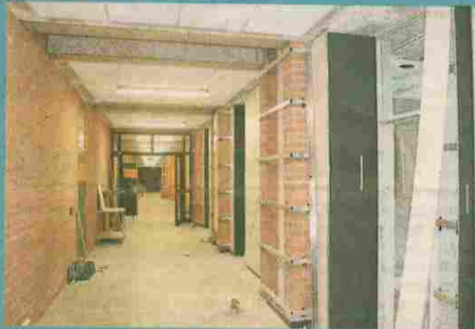
Nach dem Umbau sind die Räumlichkeiten besonders im A-Trakt kaum wiederzuerkennen.

ganz neue Verbindung zwischen dem A- und dem C-Trakt geschaffen. Durch diesen Übergang ist nun alles leicht erreichbar und dank des neuen Fahrstuhls auf allen Etagen auch ebenerdig. Komplettiert wird alles durch eine behindertengerechte Toilette.